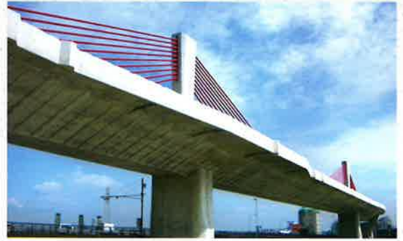
名古屋高速 新名西橋 [愛知県]

普通ポルトランドセメントと比べて、鉱物組成でけい酸三カルシウムを多くし、比表面積を高めた初期強度の大きいセメントです。そのため、寒冷期工事、各種緊急工事、プレストレストコンクリート工事、コンクリート製品等に広く利用されています。