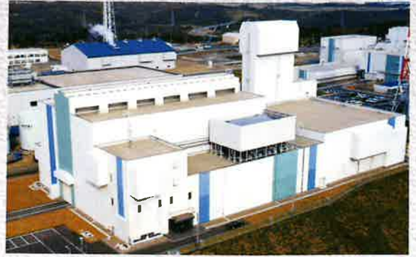
廃棄物管理施設[日本原燃(株)/青森県]

微粉炭燃焼の際に副産される良質なフライアッシュをポルトランドセメントと均一に混合したセメントです。長期強度が大きく流動性に優れ、水和熱も小さいことから、ダムなどのマスコンクリート工事に適しています。なお、フライアッシュの分量により、A種・B種・C種が、JIS R 5213で規定されています。